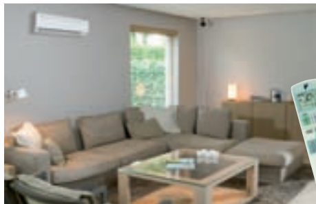
FTK/X 20, 25, 35 GV típusú beltéri egység