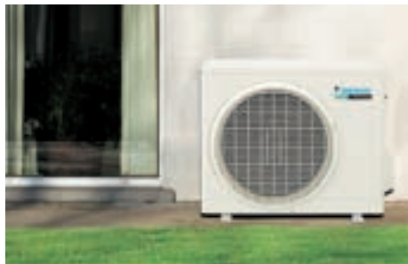
RK/RX 20, 25, 35 GV típusú kültéri egység